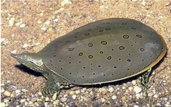
Mehkoščitka Apalone spinifera iz vzhodnih predelov ZDA.

Emydidae (sklednice) so sladkovodne in v manjši meri kopenske s težiščem razširjenosti v Severni Ameriki in enim evropskim rodom z našo edino avtohtono celinsko želvo Emys orbicularis . Nekatere izmed veliko bolj pestrih in barvitih ameriških vrst so priljubljene domače živali, npr. rdečevratka ( Trachemys scripta ), ki je ponekod postala problematična tujerodna vrsta evropskih stoječih voda. Pretežno kopenski rod škatlaric ( Terrapene ) je navidez podoben kornjačam. Konvergence povezane s kopenskim življenjem, so opazne v zgradbi nog, strukturi karapaksa, njegovi visoki obokanosti, in celo barvnem vzorcu.