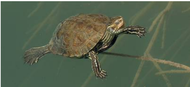
Rečna sklednica je avtohtona evropska želva, ki jo lahko z malo sreče opazujemo v južnih predelih bivše Jugoslavije.

Geoemydidae (sklednice starega sveta), znane tudi kot Bataguridae, so velika družina sladkovodnih in amfibijskih vrst razširjenih večinoma v Aziji. Na Iberskem in Balkanskem polotoku živita dve vrsti rodu Mauremys (rečna sklednica).