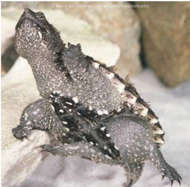
Mlada hlastavka ( Chelydra serpentina ) razkazuje svoj rudimentarni trebušni ščitik.

Chelydridae (hlastavke) so majhna družina amfibijskih želv z zelo znanimi in napadalnimi predstavniki, predvsem severno- in srednjeameriško hlastavko, ki je skrivanje v oklepu zamenjala za bolj aktivno obrambno taktiko. Ostre, kljunaste čeljusti, zelo močan ugriz, hitri refleksi in agresivno vedenje so dovolj, da odvrnejo večino potencialnih plenilcev. Glave ne more skriti pod oklep, plastron je močno reduciran.