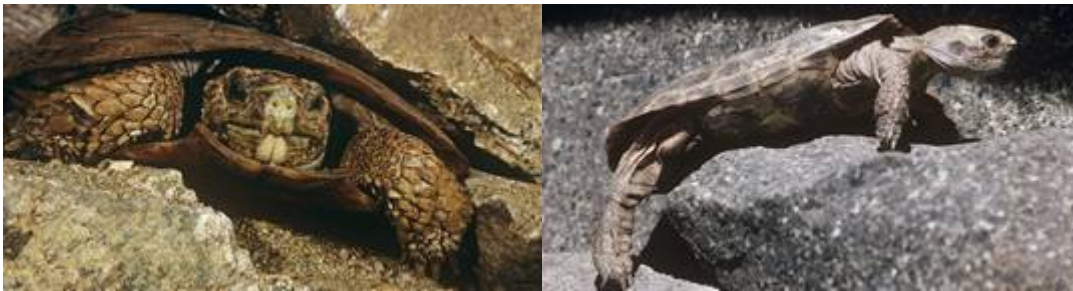
Malacochersus tornieri : Pri skrivanju v skalnih špranjah je bolj uporaben mehak in upogljiv, kot pa visok in trden oklep. (avtorja slik Zig Leszczyński in Wardene Weisser)

nošenje velike teže, kratki prsti imajo le po dve falangi, močne luske na nogah, tvorijo dodatno zaščito mehkih delov, ko so vptegnjene pod oklep. Prevladuje rastlinojeda in vsejeda prerana. Zelo velike so vrste rodu Geochelone , največje (prek enega metra dolge in 300 kg težke) med njimi na oceanskih otokih Galapagos in na Sejšelih. Pojav, ki mu pravimo gigantizem, je očitno vzniknil mnogokrat neodvisno in je znan pri številnih vretenčarjih (npr. novozelandske ptice, komodoški varani). Enotne razlage zanj ni, znani so nasprotni primeri zmanjšanja telesne velikosti pri otoških vrstah. Pri celinski vrsti G. denticulata so pokazali, da že pri 40 cm dolžine oklepa lahko kljubujejo ugrizu jaguarja, ki je največji plenilec na celini. Pri teh želvah gigantizem pripisujejo znižani kompeticiji. Veliko telo je po tej razlagi razkošje, ki si ga lahko privoščijo, ne pa posledica selekcije v prid velikanom. Za želvo nenavaden način življenja imajo gofri ( Gopherus ) iz južnih predelov Severne Amerike. Živijo namreč fosorno, t.j. v več metrov dolgih in globokih rovih, ki si jih sami izkopljejo. Še bolj presenetljiva je vzhodnoafriška vrsta Malacochersus tornieri . Njeno angleško ime "pancake tortoise" zgovorno opisuje sploščeno obliko oklepa, ki je vrh tega še mehak in upogljiv zaradi nepopolne osifikacije koščenega dela. Hitro teče in spretno pleza po skalovju, v nevarnosti se zateče v skalno razpoko namesto pod lasten oklep.