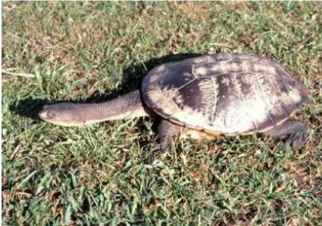
Kačjevratka ( Chelodina longicollis ) iz Avstralije. (avtor slike John Wombey)

Največja družina so kačjevratke (Chelidae), z zelo dolgim vratom (skupna dolžina vratu in glave presega dolžino oklepa). Ena najbolj nenavadnih želv, bizarna južnoameriška matamata ali resasta želva ( Chelus fimbriatus ), je priljubljena v akva-teraristiki in je izdatno predstavljena na spletu, tudi v slovenščini.