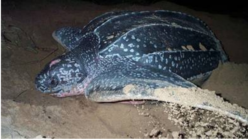
Samica usnjače je prišla na kopno le, da odloži jajca.

temperaturo vode. Metabolni model izdelan na osnovi usnjačinega metabolizma in telesne temperature je pokazal, da pri tako velikih in večjih ektotermih (npr. pri izumrlih morskih diapsidih in dinosavrih) metabolizem enak tistemu pri velikih endotermih (sesalcih). Poraba kisika je pri slonu (0,07 litra O 2 na kilogram na uro) skoraj enaka usnjačini pri normalni telesni aktivnosti (0,06 l O 2 /kg h). Primer usnjače nas uči, da imajo zelo velike živali stalno telesno temperaturo že samo zaradi svoje velike mase. Ob aktivni uporabi izolacije (protitočni sistemi, pomik cirkulacije proti periferiji ali od nje proti središču telesa) so velike endotermne živali lahko konkurenčne sesalcem v mrzlem okolju.