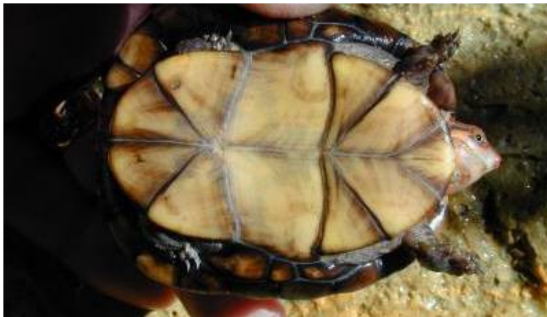
Kinosternon scorpioides z dvema sklepoma v plastronu.

V prvi vrsti se želva razlikuje od drugih živečih tetrapodov po oklepu, ki ga sestavljajo dermalne koščene (izjemi sta trebušna entoplastron in parni epiplastron, ki sta spremenjeni interklavikula oz. klavikuli) in rožene plošče, izjemoma debela, usnjasta koža (npr. pri mehkoščitkah in usnjačah). Vretenca in rebra so zrasla s koščenim, obokanim hrbtnim ščitom ali karapaksom (iz 59 koščenih plošč in ploščic v eni sredinski - mediani, dveh bočnih – lateralnih in dveh robnih - perifernih vrstah), trebušno stran prekriva bolj ali manj raven plastron (iz 9 koščenih plošč in ploščic). Rožene plošče po obliki in velikosti ne sovpadajo s koščenimi, prek katerih so prirasle. Karapaksa in plastron sta spojena na robovih prek mostiča – koščene ali hrustančne povezave, ki v slednjem primeru omogoča nekaj gibljivosti. Oklep torej ni nujno povsem rigid. Sklepna gibljivost v sprednjem delu plastrona je znana npr. pri evropskih sklednicah ( Emys ), severnoameriške kopenske sklednice, imenovane škatlarice ( Terrapene , fam. Emydidae) lahko privzdignejo sprednji in zadnji del plastrona, severno- in srednjeameriške zaklepnice ( Kinosternon , fam. Kinosternidae) celo prek dveh sklepov, afriška zobčasta sklepnica ( Kinixys , fam. Testudinidae) pa ima gibljiv zadnji del karapaksa.