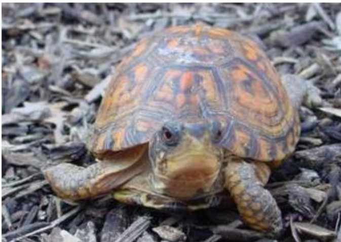
Škatlarice ( Terrapene ) so na prvi pogled bolj podobne evropskim kopenskimi želvam, kot pa drugim sklednicam.

Emydidae (sklednice) so sladkovodne in v manjši meri kopenske s težiščem razširjenosti v Severni Ameriki in enim evropskim rodom z našo edino avtohtono celinsko želvo Emys orbicularis . Nekatere izmed veliko bolj pestrih in barvitih ameriških vrst so priljubljene domače živali, npr. rdečevratka ( Trachemys scripta ), ki je ponekod postala problematična tujerodna vrsta evropskih stoječih voda. Pretežno kopenski rod škatlaric ( Terrapene ) je navidez podoben kornjačam. Konvergence povezane s kopenskim življenjem, so opazne v zgradbi nog, strukturi karapaksa, njegovi visoki obokanosti, in celo barvnem vzorcu.