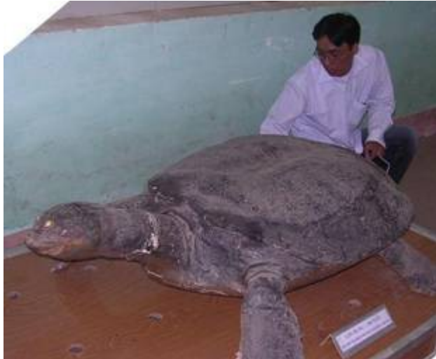
Orjaška mehkoščitka Rafetus swinhoei se bo verjetno ohranila le kot muzejski preparat in lokalna legenda.