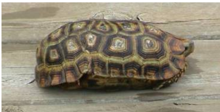
Kinixys spekii s poveznjenim zadnjim delom karapaksa.

Skelet – prsni koš s pripadajočimi vretenci je prirasel ob koščeni del karapaksa, tako da ležijo vsi notranji organi želve vključno z oplečjem in okolčjem ne le znotraj oklepa, temveč celo znotraj prsnega koša. Predkrižnih vretenc je vsega 18, od teh je 8 vratnih in 10 trupnih. Centri slednjih so prirasli ob sredinske plošče karapaksa, podolgovati in v sredini zoženi. En par reber se povezuje s po dvema vretencema.