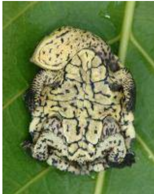
Zvijanje vratu pri vijevertkah poteka v vodoravni ravnini, glava je bočno pomaknjena pod oklep; Mesoclemmys dahli , mlad osebek, J. Amerika.

Sposobnost takega skrivanja glave pod oklep je povezana s posebno zgradbo vratnih vretenc, ki morajo omogočati ostro upogibanje v vertikalni ali horizontalni ravnini. Nekatere vrste (morske želve, hlastavke) so to sposobnost izgubile.