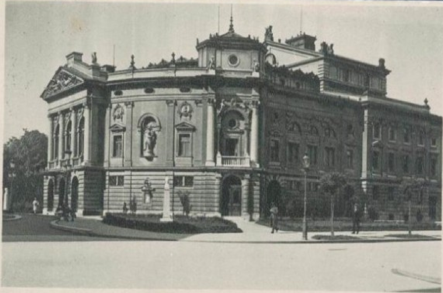
Ljubljana - opera