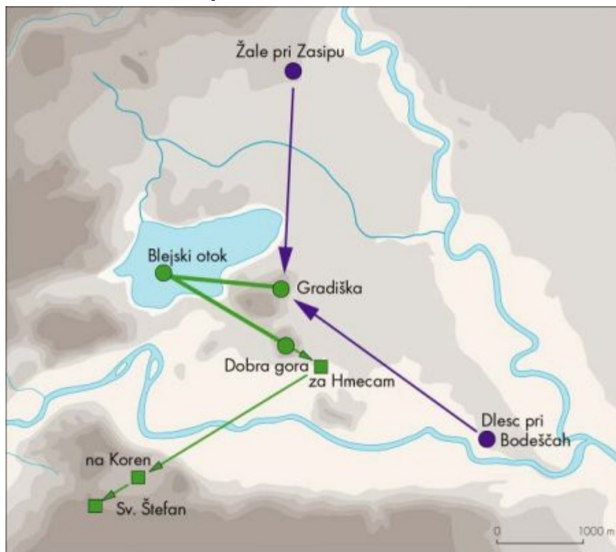
Slika 2. Bled. Tri kulturna mesta in usmeritev posameznih najdišč. Plastnice so na 40 m višinske razlike.

Značilno prostorsko strukturo neke župe kaže karniolaška župa Bled v severozahodni Sloveniji (Slika 2). Najpozneje v drugi polovici 7. st. so njeni prebivalci določili tri kulturna mesta. Na Blejskem otoku so čestili Mokoš, na Gradiški Velesa in na Dobri gori Peruna. Te tri točke določajo obredni kot 23^\circ . Na Blejskem otoku danes stoji Marijina cerkev. Arheološka izkopavanja so odkrila ostanke starejših cerkvenih zgradb. Najstarejša stavba pa je bila lesena. Usmerjena je bila proti Gradiški. Enako so bili usmerjeni tudi grobovi iz 9. in 10. st., ki so bili izkopani poleg nje. Že prva predromanska kamnita cerkev ni več prevzela opisane usmeritve, kar kaže, da so prevladale drugačne religiozne predstave.