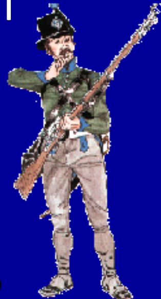
Vojak Kraljevskega istrskega bataljona (Battaglione Reale d'Istria) iz obdobja 1805-1809