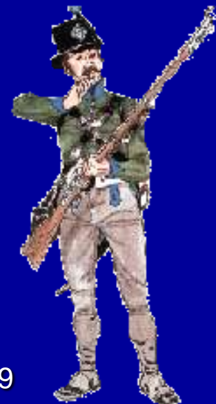
Vojak Kraljevskega istrskega bataljona (Battaglione Reale d'Istria) iz obdobja 1805-1809