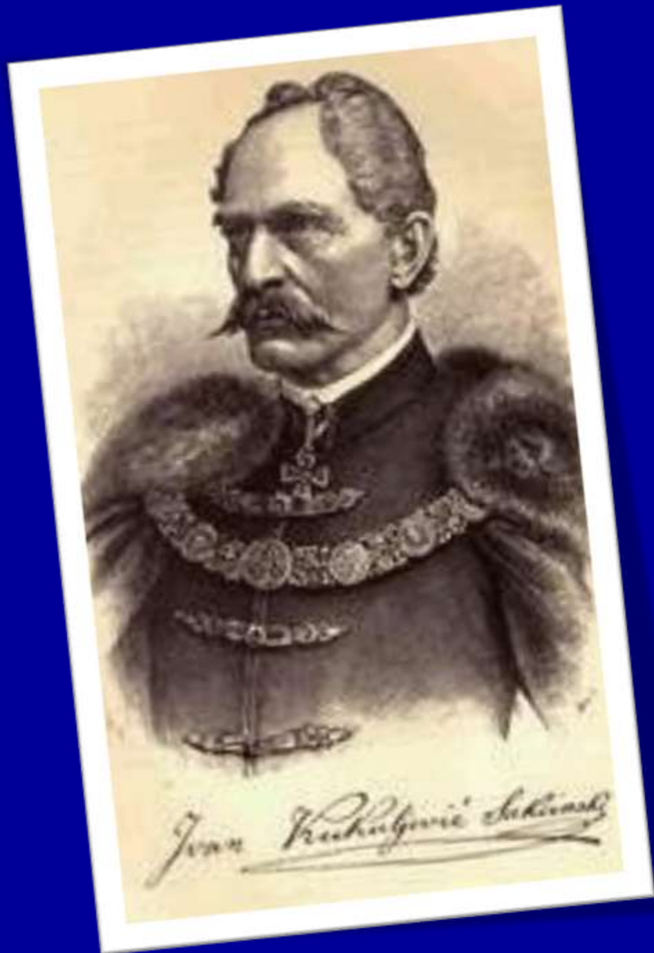
Ivan Kukuljević Sakcinski hrvaški politik in kulturnik (*29.5.1816 - † 1.8.1889)