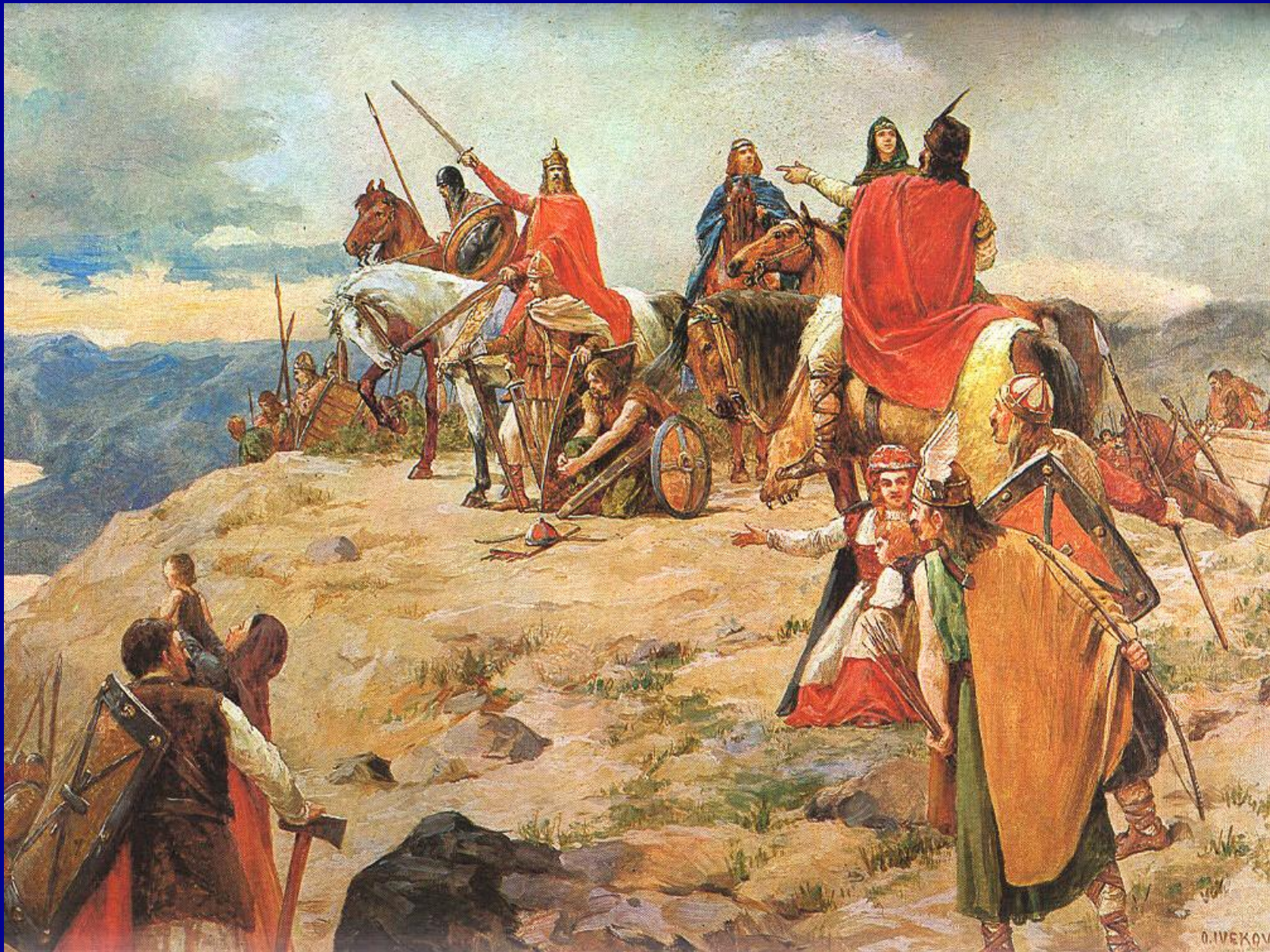
Oton Iveković, Dolazak Hrvata na Jadran (1905)