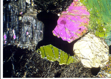
Slika 8 Euhedralna zrna rombičnega piroksena