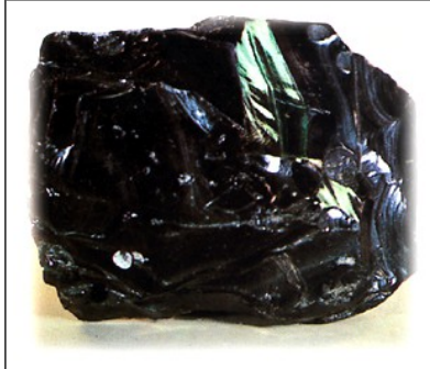
Slika 7 Steklasta - obsidijan