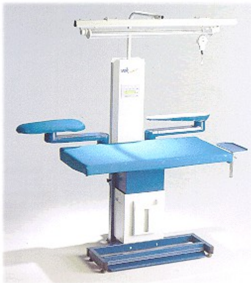
Vakuumska likalna miza