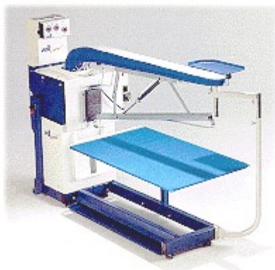
Likalna miza za hlače