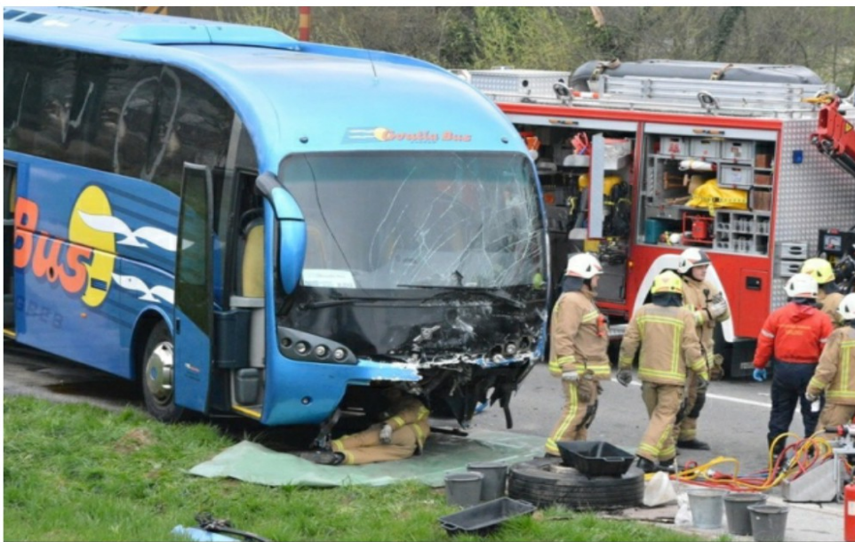
Tragična prometna nesreča pri Karlovcu

V Gornjem Mrzlem Polju, med Dugo Reso in Karlovcem, se je včeraj zgodaj zjutraj zgodila huda prometna nesreča, v kateri sta bila udeležena osebni avtomobil in avtobus.