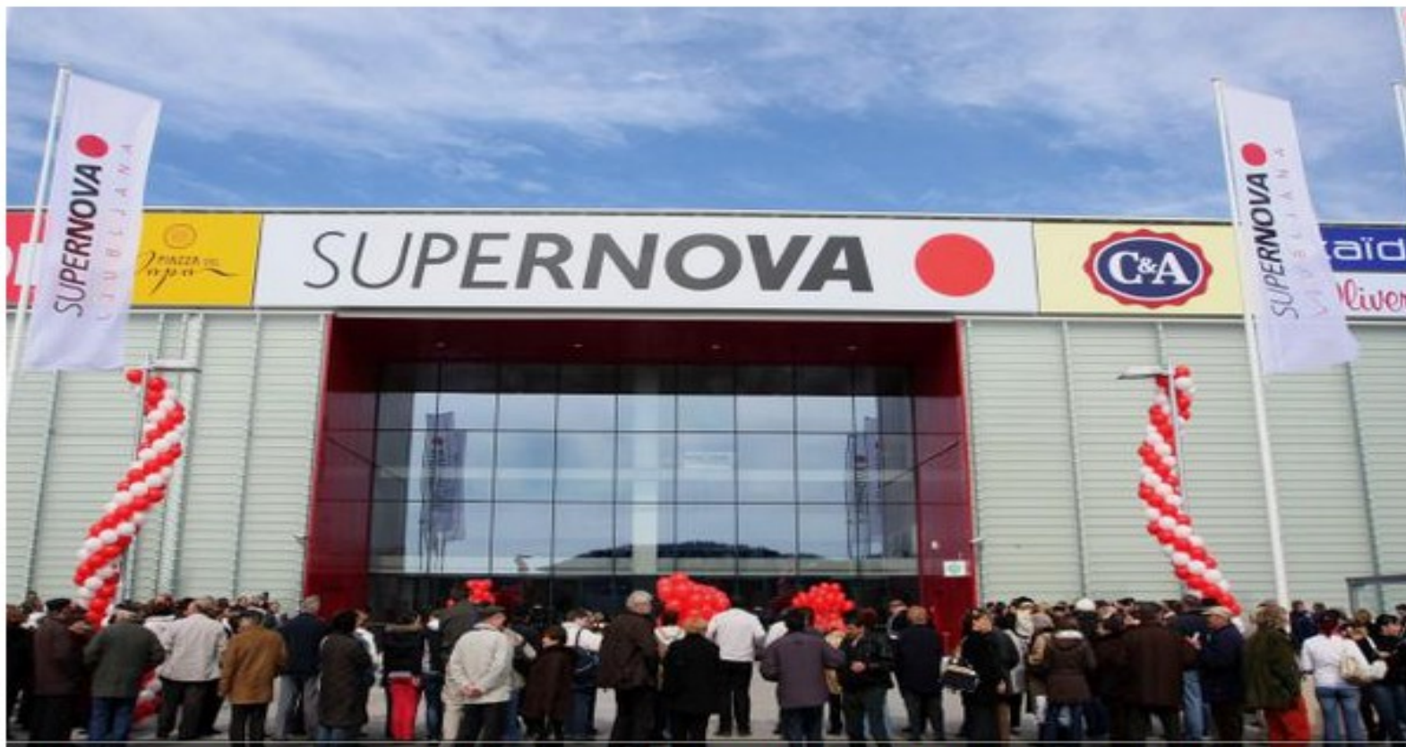
Tako so nakupovalno središče Supernova na Rudniku odprli leta 2008.

Gorelo naj bi, pravi bralka, ki je v tistem trenutku tam ravno nakupovala.