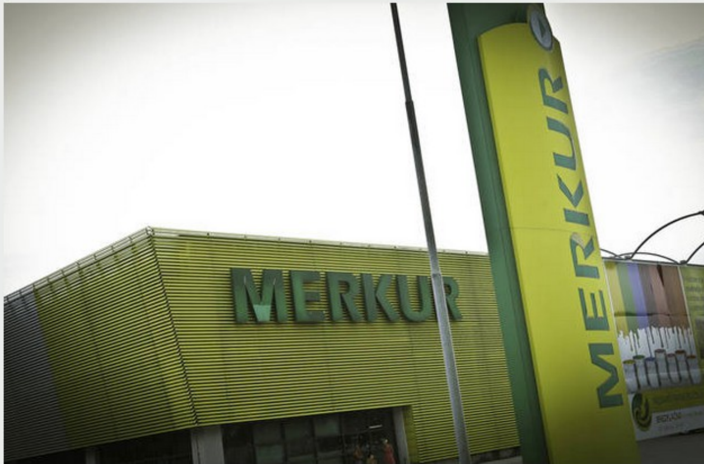
Moški je "znorel", ker je dobil le petodstotni popust. Simbolična fotografija.

Ključne besede: javni red in mir , kršitve , popust , Jesenice , policija