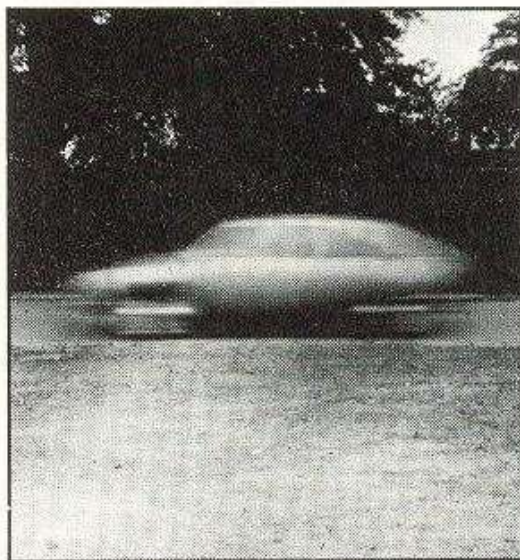
Avtomobil vozi mimo snemalca, slika je pri osvetlitvi 1/125 sekunde nejasna.

Pri gibajočih objektih je slika pri daljših časih osvetlitve nejasna.