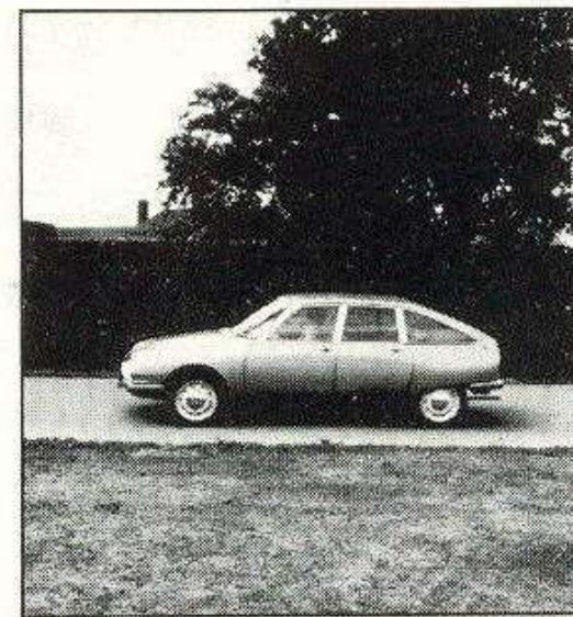
Čas osvetlitve 1/500 sekunde, gibanje mimo vozečega avtomobila smo zamrznili.