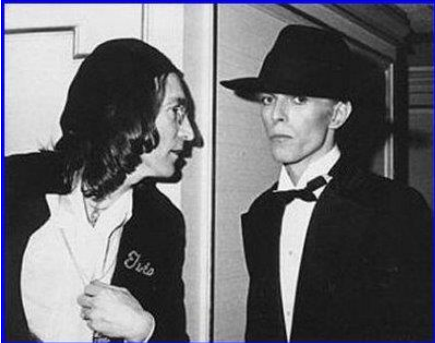
John Lennon in David Bowie, New York 1975