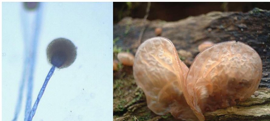
GLAVIČASTA KRUŠNA PLESEN IN GLJIVA