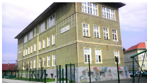
Osnovna šola Janka Padežnika

Dodava še njihovo šolo in jih sprašujeva: