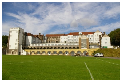
Šola v Angliji, arhitekt: Arthur Blomfield