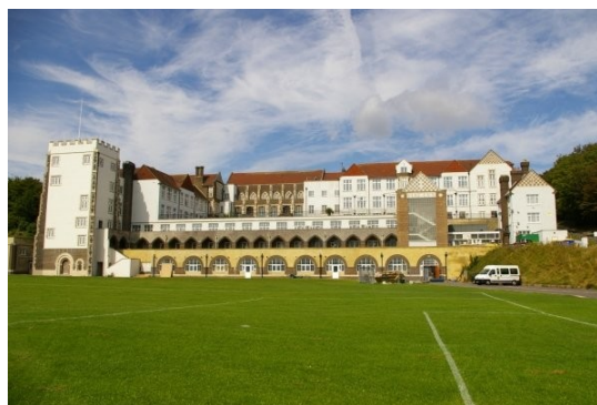
Šola v Angliji, arhitekt: