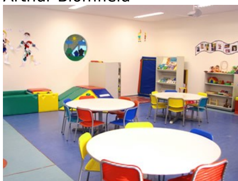
Učilnica šole v Avstraliji