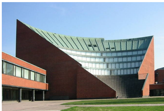
arhitekt Alvar Aalto

Učenci svoje izdelke postavijo na eno mizo pred tablo.