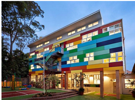
Šola v Avstraliji Arthur Blomfield