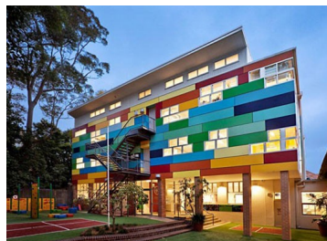
Šola v Avstraliji