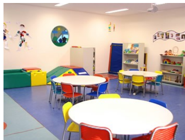
Učilnica šole v Avstraliji

Pokaževa jim sliko učilnice in jih sprašujeva: