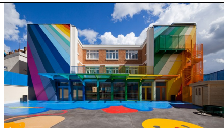
Univerza za naravoslovje in tehniko arhitekt Alvar Aalto