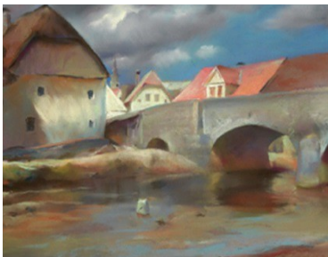
Božidar Jakac, Cerknica, 1939, pastel na kartonu pastel

Pastel je slikanje s suhimi kredami. Tehnika slikanja obsega predvsem nanašanje krede na hrapav papir, zato da se kredin prah ujame. Ko slikar naredi potezo s kredo, jo lahko s prsti osenči. Če se slikar pri delu zmoti, lahko sliko popravi. Ko je slika končana, je zaščitena tako, da je stisnjena med dve stekli oziroma med steklo in karton (na zadnji strani).