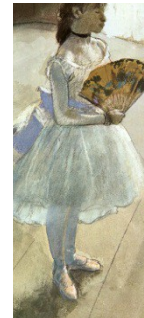
Edgar Degas, Plesalka s pahljačo, 1879,