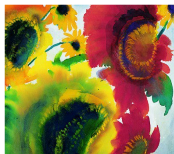
Rdeče in rumene