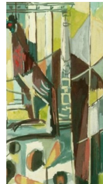
Stane Kregar, Brez naslova, tempera, gvaš