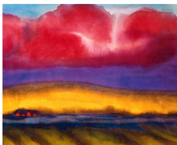
Pokrajina s kmetijo, 1935 (akvarel) sončnice, akvarel