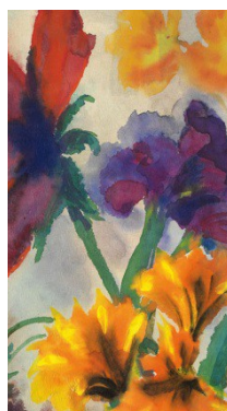
Rdeče in rumene rože, akvarel