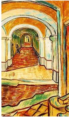
Vincent van Gogh , Hodnik v azilu, 1951, 1889, črna kreda in gvaš na papirju

Gvaš je tehnika slikanja z vodenimi barvami, ki se mešajo z gosto belo barvo (tempero). Z dodajanjem bele barve, dosežemo bogastvo tonov. Barva je gostejša kot pri akvarelu.