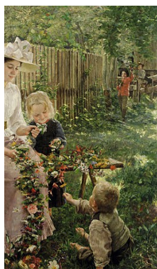
Ivana Kobilca, Poletje, 1889-90, olje-platno

Slikanje z oljnatimi barvami je proces slikanja s pigmenti, ki so pomešani s suhim oljem. Slikarji so uporabljali različna olja za enake pigmente, odvisno od specifičnega pigmenta in efekta, ki so ga želeli doseči. Umetniki so po navadi na platno najprej naredili skico z ogljem. Z različnimi primesmi kot je terpentini, so lahko pospešili sušenje slike. Barvo so nanašali v plasteh. Vsak naslednji sloj je bil bolj oljnat od prejšnjega, v nasprotnem primeru bo slika razpokala in se olupila. Barva ostane mokra dalj časa kot kater drug material in tako omogoča slikarju, da spremeni barve, teksturo ali formo figure. Slikar lahko odstrani tudi cel sloj barve in začne na novo. To lahko naredi z terpentinom in krpo, vendar samo na mokri podlagi. Kar je suhega mora spraskati dol. Oljna barva se suši z oksidacijo in navadno lahko traja dan do dva tedna.