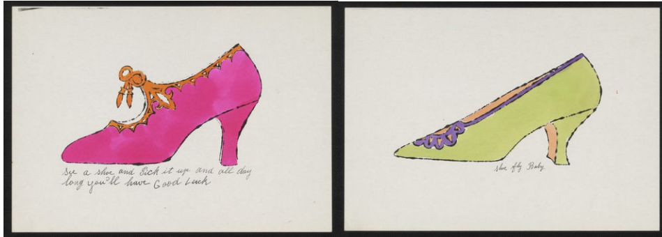
Slika : Serija čevljev

V zgodnjih letih je prebiral dela Josef Albersa in Moholy-Nagyja in se na tak način seznanil z delom Bauhauza, nemške šole sodobnega oblikovanja. V petdesetih letih je postal uspešen in dobro plačan reklamni slikar. Imel je številne razstave, vendar prodal zelo malo svojih del. Leta 1961 je ugotovil, da je svet »lepih umetnosti« označil njegovo ustvarjanje kot staromodno in nepomembno, zato je potreboval nove zamisli in ideje. Dobil je nasvet, da naj slika tisto, kar mu je najbolj pri srcu, kar ima najraje in nekaj, kar vsi poznajo. Posledica tega je razvoj slavnih podob jušne pločevinke (Campellova juha) denarni uspeh ter mednarodna slava. Na razstavi Ameriški Supermarket, v galeriji Paula Bianchinija leta 1964, je Warhlova slika jušne pločevinke stala 1,500 dolarjev, jušna konzerva z njegovim podpisom pa 6 dolarjev. (Andy Warhol Biography)