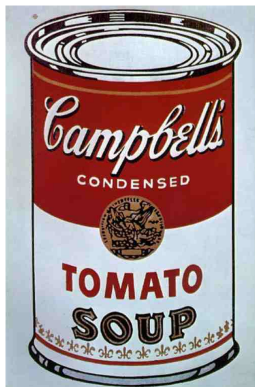
Slika : Campbells Soup Can, 1964

V zgodnjih letih je prebiral dela Josef Albersa in Moholy-Nagyja in se na tak način seznanil z delom Bauhauza, nemške šole sodobnega oblikovanja. V petdesetih letih je postal uspešen in dobro plačan reklamni slikar. Imel je številne razstave, vendar prodal zelo malo svojih del. Leta 1961 je ugotovil, da je svet »lepih umetnosti« označil njegovo ustvarjanje kot staromodno in nepomembno, zato je potreboval nove zamisli in ideje. Dobil je nasvet, da naj slika tisto, kar mu je najbolj pri srcu, kar ima najraje in nekaj, kar vsi poznajo. Posledica tega je razvoj slavnih podob jušne pločevinke (Campellova juha) denarni uspeh ter mednarodna slava. Na razstavi Ameriški Supermarket, v galeriji Paula Bianchinija leta 1964, je Warhlova slika jušne pločevinke stala 1,500 dolarjev, jušna konzerva z njegovim podpisom pa 6 dolarjev. (Andy Warhol Biography)