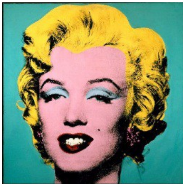
Slika : Marilyn Monroe, 1962

Warhol je rad uporabljal različne tehnike in nenavadna izrazna sredstva. Družil se je s pomembnimi znanimi osebnostmi, kot so Bob Dylan, John Lennon in dr. Bil je veren, kar kažejo tudi njegova kasnejša dela z versko vsebino, na primer serija Zadnje večerje. Leta 1968 je bil tudi ustreljen v svojem ateljeju, kar mu je pustilo posledice celo življenje (moral je nositi poseben medicinski korzet). Pri tem streljanju je krogla prelučnjala tudi slavno grafiko Marilyn Monroe (njena tragična smrt je Warhola navdihnila za upodobitev) - zato ima luknjo sredi čela. (Andy Warhol Biography) Zraven portreta Marilyn Monroe je v živih barvah upodobil tudi Elizabeth Taylor, Micka Jaggerja, Mao Zedonga in portret z naslovom Osem Elvisev, ki je bila leta 2008 prodana za 100 milijonov dolarjev. (Eight Elvises, 2012)