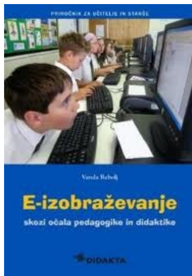
Slika 3: e-izobraževanje