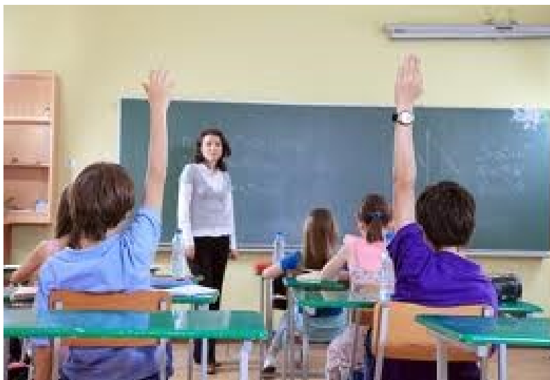
Slika 2: razred

Na samem začetku izvajanja učne ure, učitelj naredi motivacijski uvod, jasno opredeli učne cilje, učencem pove, kako jih bodo dosegli ter kako bo preverjal njihovo znanje. Navodila daje učencem sproti, saj jih sicer pozabijo. Ob delu jih učitelj spremlja in opazuje ter spodbuja delo v skupinah in odgovarja na vprašanja. Sproti si beleži opažanja, ki jih bo na koncu uporabil pri analizi ure. Učenci po opravljenem delu poročajo oziroma si izmenjajo informacije.