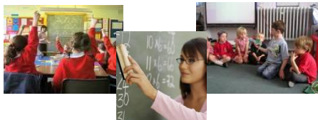
PV, Razredni pouk