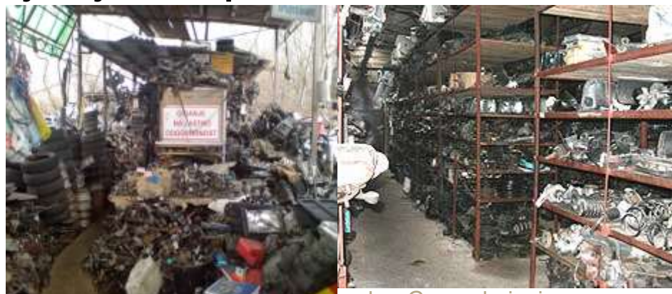
Manja marot. varstvo okolja in komunala - Gospodarjenje z odpadki